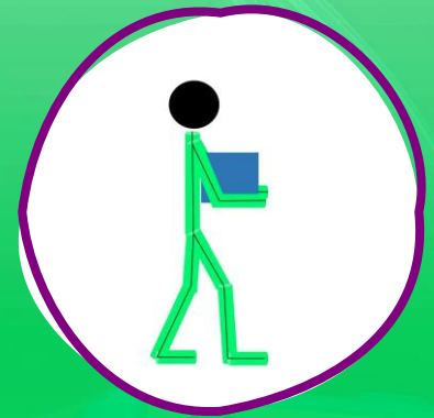
Transporte de cargas